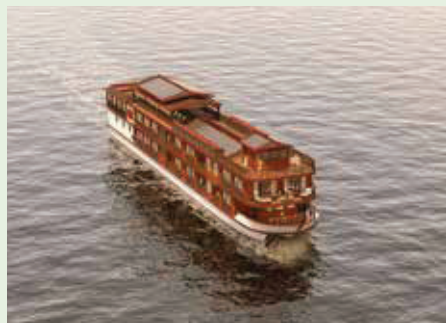
Sie fahren mit der Mekong Star.

„Erleben Sie zwischen dem Goldenen Dreieck und Vientiane eine noch sehr authentische Weltregion und ursprüngliche Flusslandschaft abseits der großen Besucherströme.“