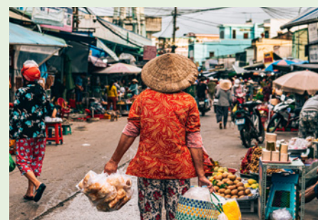
Markt in Duong Dong