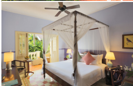
Deluxe Garden View im La Veranda Resort