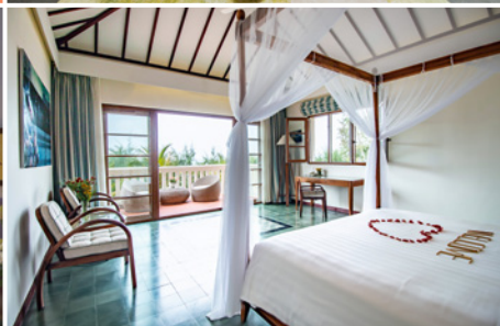
Modern Deluxe Room im Cassia Cottage Resort & Spa