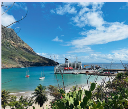
Sie fahren mit der Aranui 5.

„Mehr als nur ein Hauch von Abenteuer: Der südlichste und abgelegenste Archipel der Südsee ist noch sehr ursprünglich und unglaublich authentisch!“