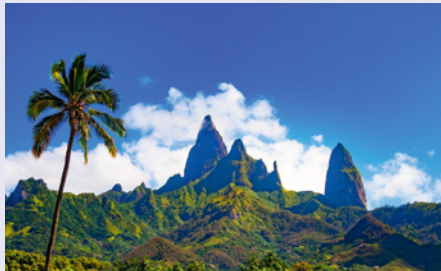
Gipfel der Insel Ua Pou