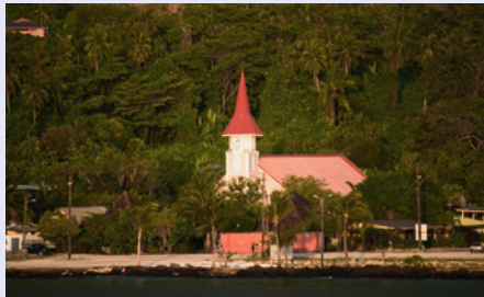
Katholische Kirche im Marquesas-Archipel