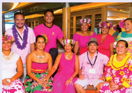
Sie fahren mit dem Postschiff Aranui 5.