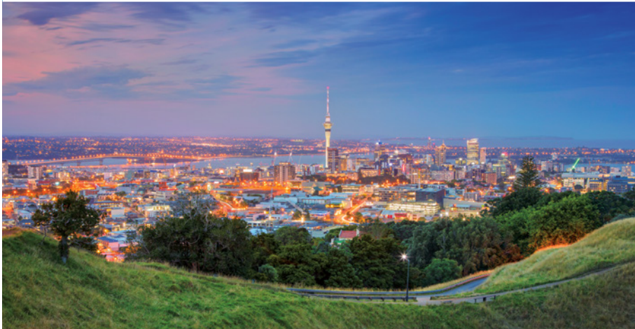
Auckland – City of Sails