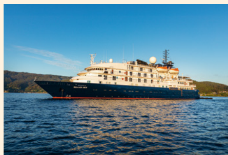
Sie fahren mit der MS Island Sky.

„Madagaskars Tierwelt ist voller Rekorde: der größte Schmetterling, die größte Heuschrecke, der älteste Fisch, das kleinste Chamäleon, das kleinste Säugetier.“