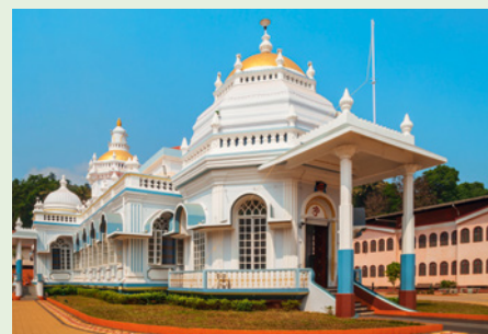
Der hinduistische Mangueshi-Tempel in Goa