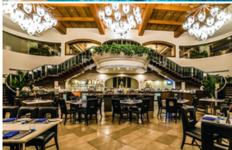
Speisesaal im Zuri White Sands Resort