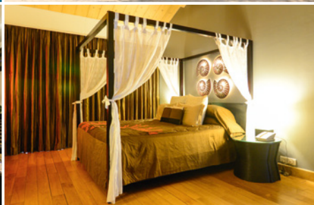
Doppelbett im Zuri White Sands Resort