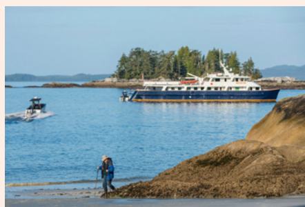
Sie fahren mit dem Expeditions-Katamaran MV Cascadia.

„Sie mögen Katzen? Geschätzt 800 Pumas leben auf Vancouver Island, die höchste Konzentration dieser Großkatze in ganz Nordamerika!“ Claudia Umscheid, Nordamerika-Expertin