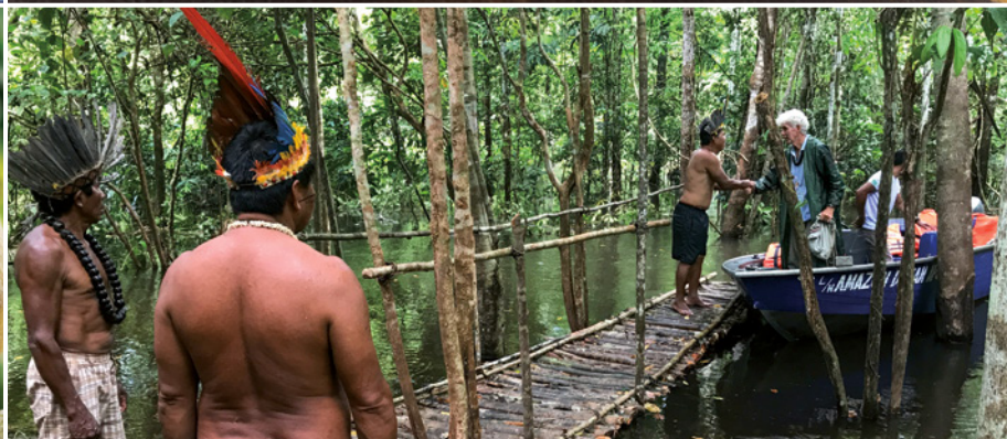
Per Beiboot zu den Ticuna