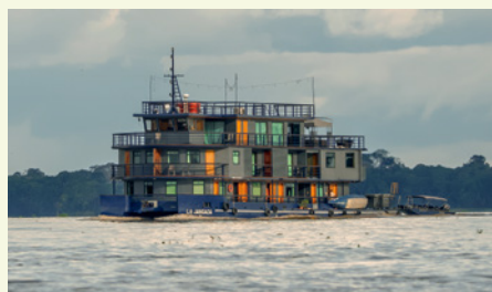
Sie fahren mit der MS Jangada.

„Extrem üppige Artenvielfalt – drei Wörter, die den Superlativ des Pantanals am besten beschreiben!“