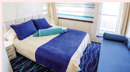
Sie fahren mit der MS Moonlight Sonata. Details finden Sie auf Seite 90.