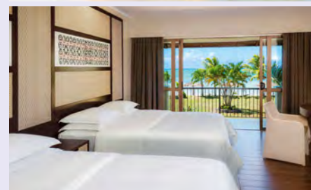
Ihr Hotelzimmer im Sheraton Samoa Beach Resort

„Beste Vorbereitung auf die mystischen Südsee-Riten: Robert Louis Stevensons Erzählung Der Flaschenteufel . Auf Upolu besuchen Sie übrigens sein Grab!“