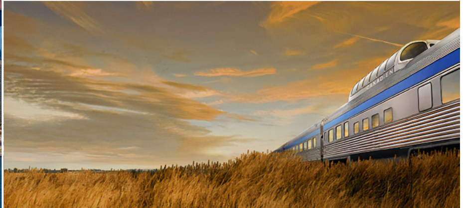
Durch die Prärie mit dem Canadian

ein leckeres Frühstück genießen. Gestärkt starten Sie Ihre Stadtrundfahrt. Québec City wurde von den Vereinten Nationen zum Weltkulturerbe erklärt und ist eine wahre Freude für Fotografen! Sie besichtigen die Altstadt mit der historischen Stadtmauer, den Battlefields Park, die Zitadelle und die kunstvollen Stadttore der Oberstadt. Der Rest des Tages steht Ihnen für eigene Erkundungen in der verwinkelten Stadt zur Verfügung. (F)