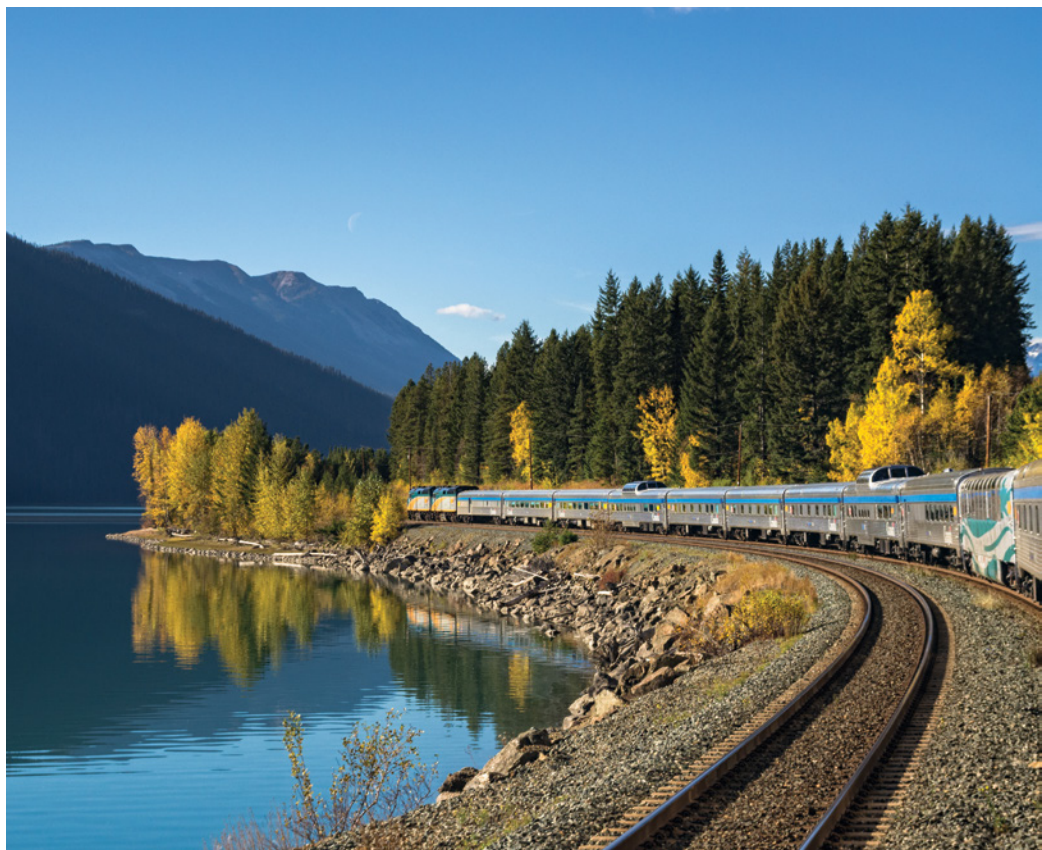
Am Moose Lake in Alberta