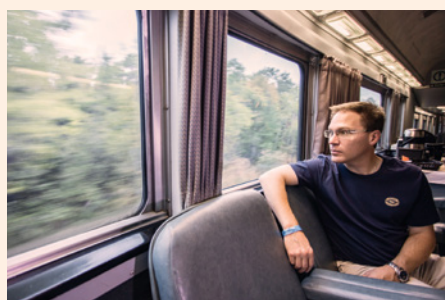
Mit dem Ocean durch Ost-Kanada

„Kanada ist ein Land der Superlative: 62 % aller Seen weltweit befinden sich dort, über 1,4 Millionen!“